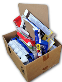
Lose in ungeschnürter Schachtel