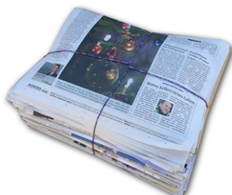
Zeitungen / Papier gebündelt