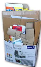
in offener Kleinschachtel geschnürt: