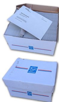
Couverts ohne Fenster in Schachteln: