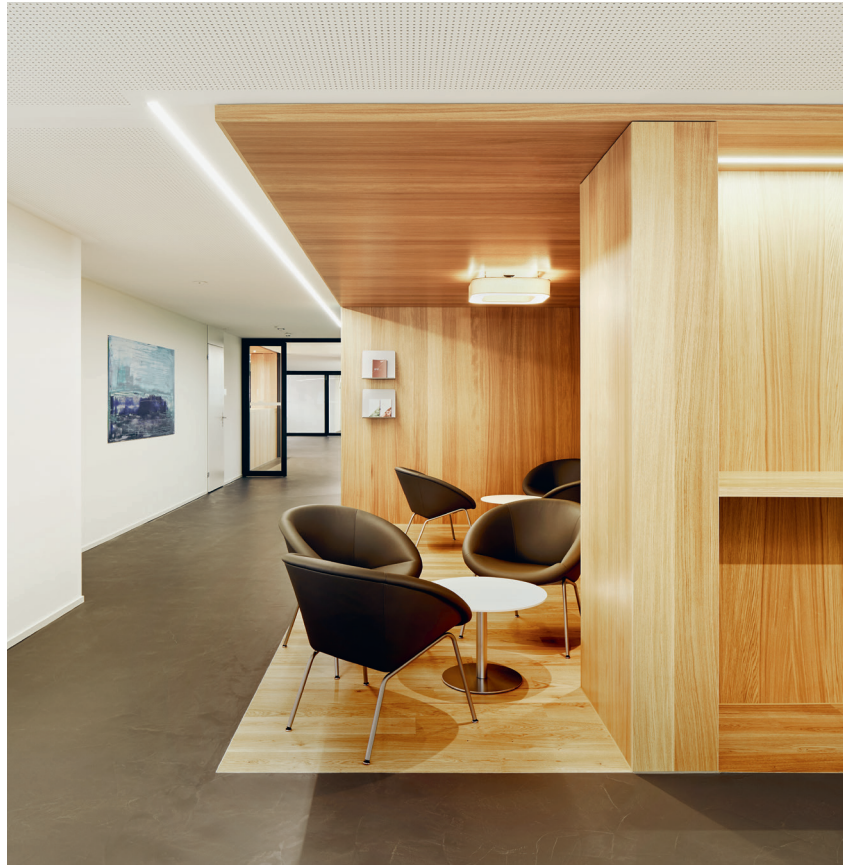
Wo Nähe fühlbar ist: Die Standorte der Psychiatrie St.Gallen schaffen Geborgenheit und Vertrautheit.