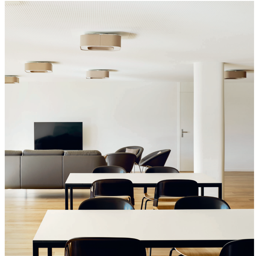
Wo Respekt gelebt wird: Die Räume der Psychiatrie St.Gallen eröffnen vielseitige Möglichkeiten zum Dialog.