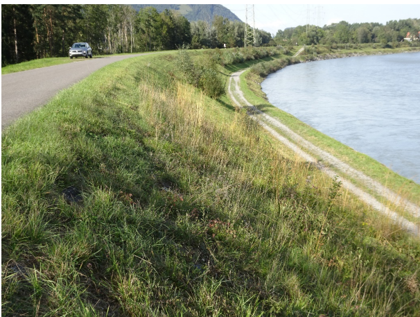
Schachbrettartiges Mähregime mit Erhalt einzelner Buschgruppen am Alpenrhein