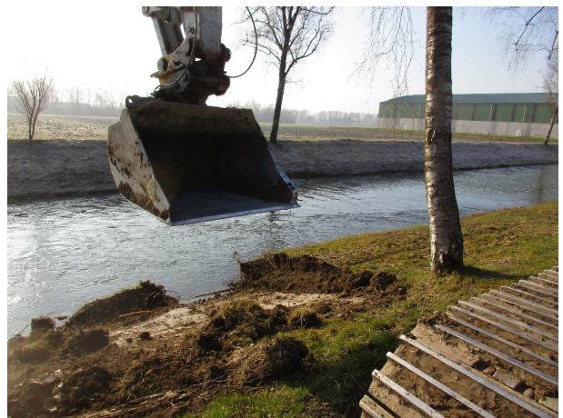
Entfernung von Böschungswülsten

Bei Unklarheit über das zu wählende Verfahren gibt das Amt für Natur, Jagd und Fischerei gerne Auskunft.