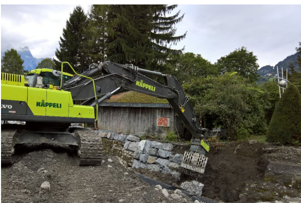
Ersatz einer Ufersicherung

Wenn Gefahr in Verzug ist, kann die kantonale Fachstelle eine Bewilligung zum vorzeitigen Baubeginn erteilen.