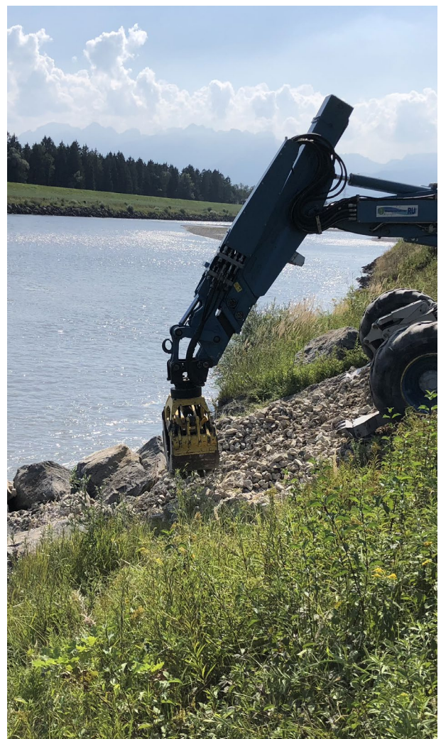
Arbeiten im Bereich des Rheinwuhrs

Bei Unklarheit über das zu wählende Verfahren gibt der kantonale Wasserbau gerne Auskunft.