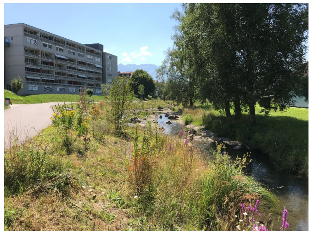
Ökologisch wertvolles Gewässer im Siedlungsgebiet mit unterhaltener Ufervegetation

Bei allen Eingriffen in die Gewässer sind die ökologischen Aspekte zu berücksichtigen. Es gilt: So wenig Eingriffe wie möglich, so viel wie nötig.